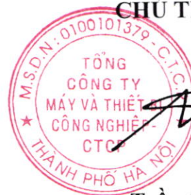
Trần Quốc Toàn